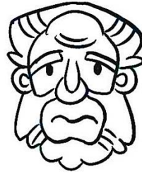
亞勒腓的兒子雅各