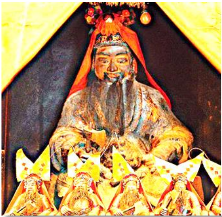
西貢蠔涌車公廟 (車公像)