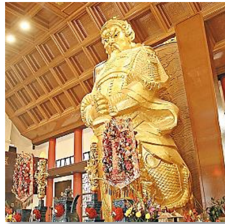
沙田車公廟 (車公像)